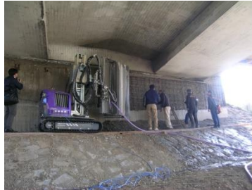
現場視察 橋梁補修工事 ロボットによるハツリ コンクリートがぜい弱で、 鉄筋量も少なかった。