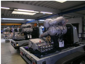
排ガス対応の トレーラジェット125

昨年販売された「マルチワーカー250」に続き、 来年に向けてロボットタイプの新商品が発売予定です。 また、ポンプも将来5000気圧を開発する予定です。