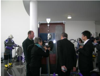
ツイスター30 機械の説明を受ける