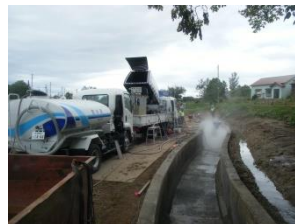
農業用水路補修工事 北海道