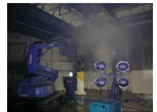
船舶洗浄工事 北海道