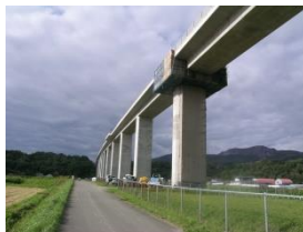
高速道路補修工事 北海道