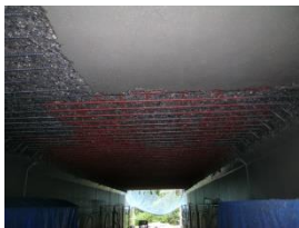
ボックスカルバート補修工事 宮城県